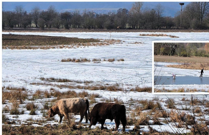
Der letzte Draht zwischen Mensch und Bullen ist zerschnitten. Zwei Galloway-Bullen scheinen die zugefrorene Radenhäuser Lache zu bewachen. Nur zwei Eisläufer wagen sich auf die blankgefegte Eishockey-Fläche.

Inzwischen hat sich die Lage entspannt. Am Donnerstag gegen 15 Uhr befanden sich nur zwei Eisläufer auf dem Eis. Am späten Nachmittag war nur ein halbes Dutzend Autos vor dem Zugang abgestellt – möglicherweise eine Folge der Polizeipräsenz an diesem Nachmittag.