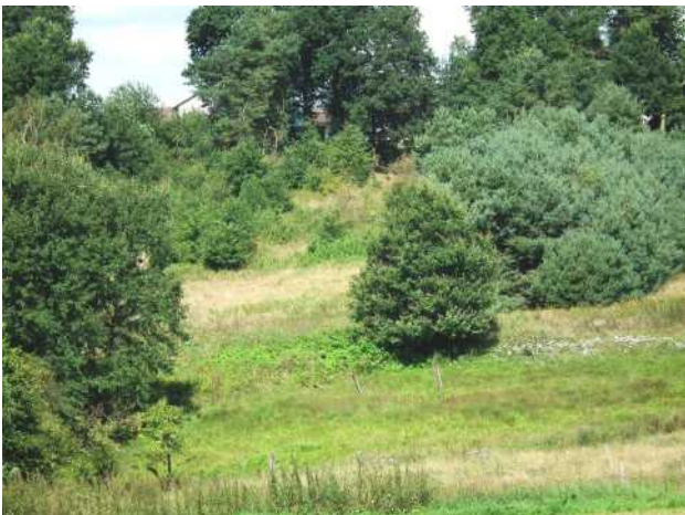
Wacholderheide vor Entbuschung

Am Ortsrand von Mengsberg befand sich eine Wacholderheide, die bereits stark verbuscht war. Auf Empfehlung der Agentur Naturentwicklung etablierte die Stadt Neustadt dort unter Einbeziehung angrenzender Grünlandflächen ein Beweidungsprojekt. Weidetiere sind hier Rotes Höhenvieh und Schafe. Vor einer Beweidung musste die Wacholderheide jedoch entbuscht werden. Danach wurde ein Festzaun gezogen und die Tiere aufgetrieben. Die Stadt Neustadt ‘eröffnete’ das Projekt Mitte Mai im Rahmen der Neustädter Umweltwoche. Zwei Tafeln informieren über das Projekt und die mit der Beweidung verfolgten Ziele. Das Projektgebiet wird von der Agentur Naturentwicklung betreut.