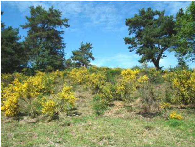
Ginsterheide im Juni

Arbeit geleistet. Es wird jetzt zu beobachten sein, wie die Schafe im Winter den Verbiss weiter führen und welche Entwicklung die Projektfläche zukünftig nehmen wird.