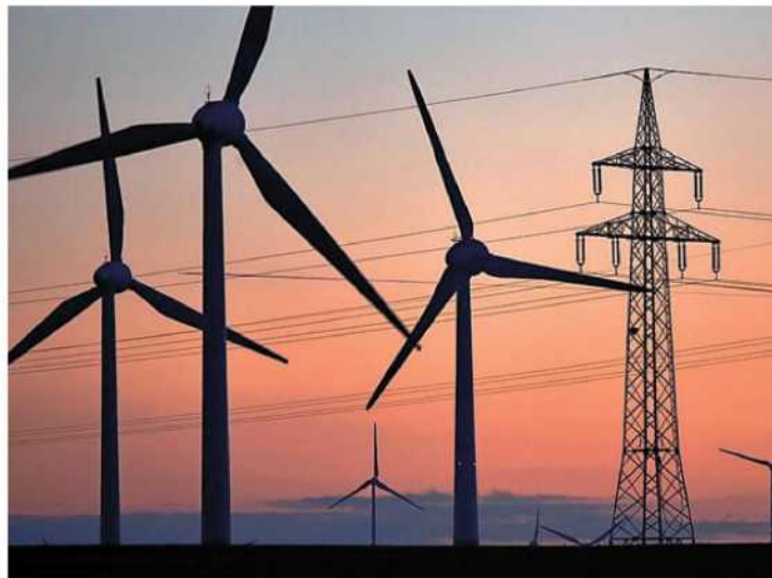
Ein Naturwissenschaftler glaubt, dass um Marburg herum zum Erreichen der Energiewende bis zu 50 Windkraftanlagen gebaut werden müssten.

Dunkelflaute und Verluste durch notwendige elektrochemische Zwischenspeicherung der Energie wie auch die Batterie-Selbstentladung und kritische Ökobilanz bei der Batterie-Herstellung seien hier einmal vernachlässigt. Nun zur Frage: Wie viele moderne WKA werden benötigt,